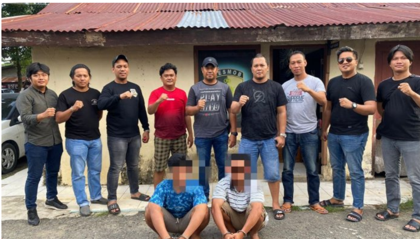
Tim Resmob Reskrim Polres Morowali saat menangkap pelaku pembunuhan

MOROWALI, Sulawesi Tengah- Pelaku penikaman perut terburai keluar hingga menyebabkan korbannya meninggal dunia inisial E (29) yang baru-baru ini terjadi di wilayah Kecamatan Bahodopi telah berhasil di tangkap Satreskrim Polres Morowali.