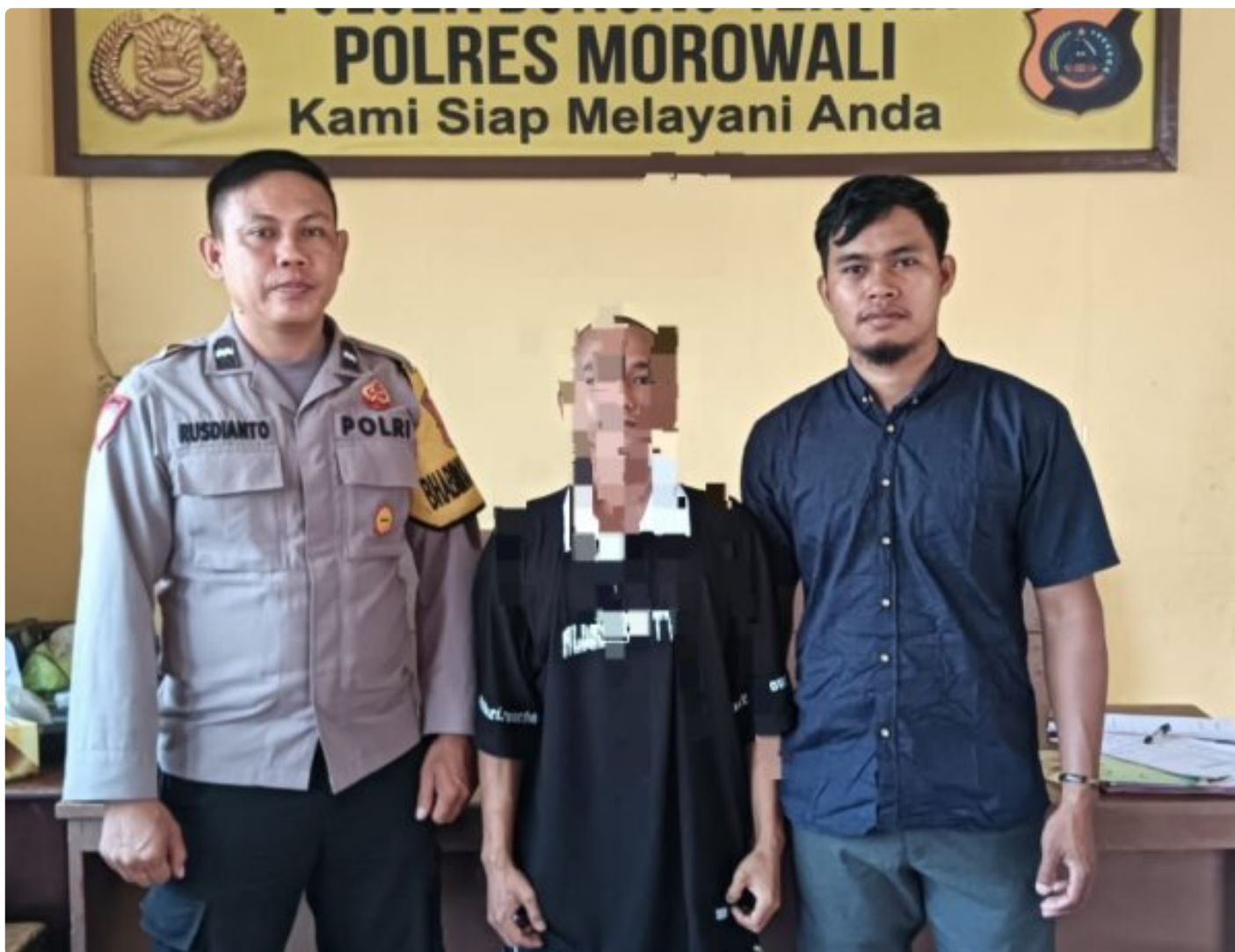
Aparat Polsek Bungku Tengah Berhasil Tangkap Pelaku Curanmor

MOROWALI, Sulawesi Tengah- Pada Hari Sabtu 5 Oktober 2024 Sekitar Pukul